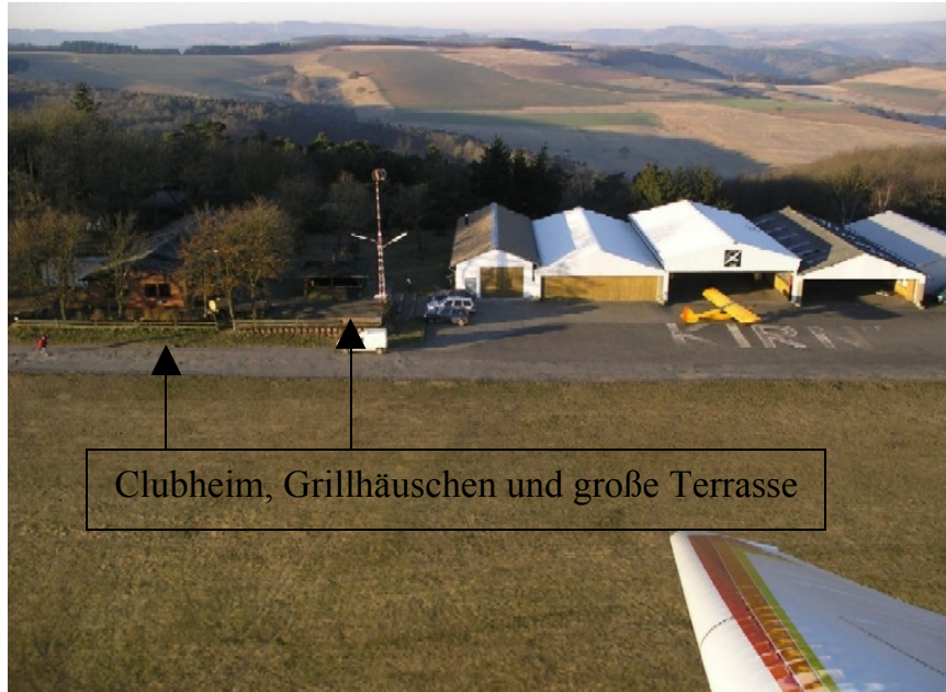
Clubheim, Grillhäuschen und große Terrasse