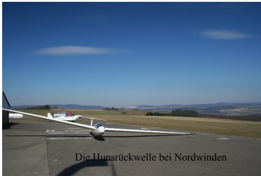
Die Hunsrückwelle bei Nordwinden